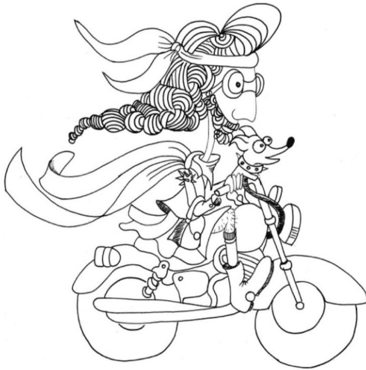
Illustration 3: Elio als nichtbinäre erwachsene Person