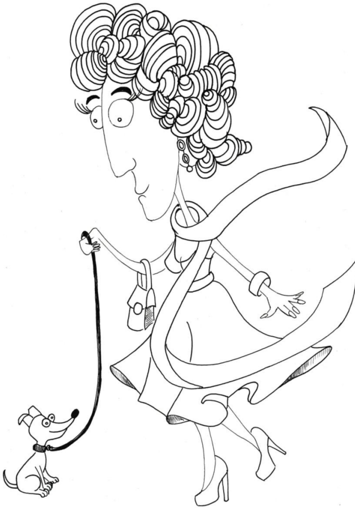
Illustration 4: Elio als erwachsene trans* Frau