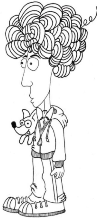
Illustration 1: Elio mit elf Jahren