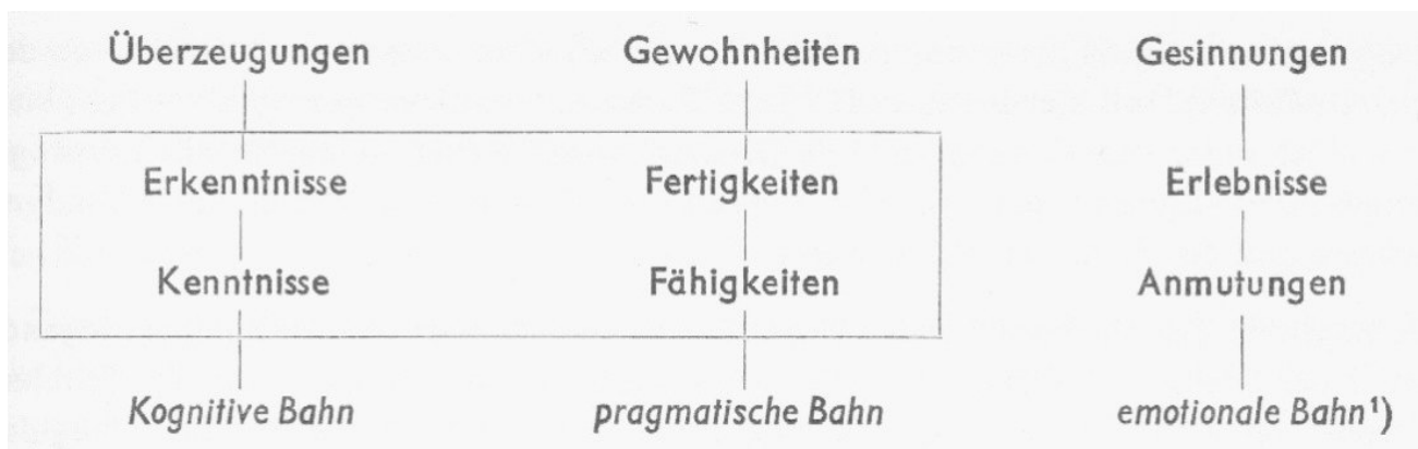
Abbildung 2: Schema zur Unterrichtsvorbereitung nach Wolfgang Schulz (Trümper/Otto 1966, S. 255).

angesehen. In der Kunstdidaktik rückte seit Mitte der 1960er Jahre die Unterrichtsplanung und „-kontrolle“ in den Fokus, was u.a. mit der neuen Lehrer:innenausbildung im Zusammenhang steht. An der Pädagogischen Hochschule Berlin beispielsweise wurde das sogenannte „Didaktikum“ eingeführt, ein „praktisches Halbjahr“ im Studium zwischen dem 3. und 5. Semester, dem heutigen Praxissemester ähnlich. Es ging vor allem darum, eine Besprechungsgrundlage für Hospitationssituationen zu haben: Was war das Ansinnen, wie sollte vorgegangen werden, war der Weg sinnvoll und wurden die Ziele erreicht (vgl. Engels 2017, S. 181)? In Band IV.1 des „Handbuchs der Kunst- und Werkerziehung“ aus dem Jahr 1966 wird eine „Unterrichtskontrolle im Fachgebiet Malen“ detailliert beschrieben. Anhand eines Schemas (Abb. 2) stellt Gunter Otto (der nach dem überraschenden Tod Trümpers 1965 die Federführung übernahm) heraus, „wann Zielsetzung und Gegenstand die Kontrolle der Handlung und des Unterrichtsergebnisses weitgehend ausschließen“ (Trümper/Otto 1966, S. 254).