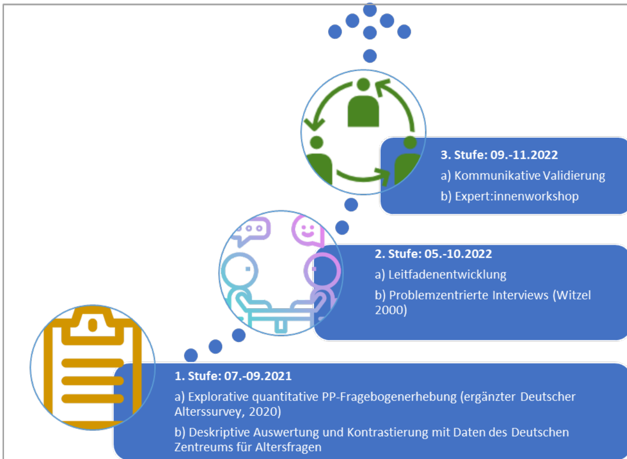
Abbildung 2: Mixed-Methods-Design in drei sequenziellen Stufen