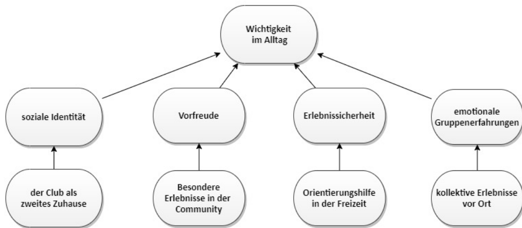
Abbildung 3: Einflussfaktoren im Beziehungszusammenhang Besucher-Community (eigene Abbildung)

Zur Entwicklung einer vertrauten, sicheren Wohlfühlatmosphäre gehören gewisse Rituale und ein emotional verankerter Wiedererkennungswert, erzeugt durch bekannte Gerüche, den Geschmack des Lieblingsdrinks oder den vertrauten Heimweg. Während der Krise können Betreiber*innen zum Beispiel digitales Storytelling betreiben, damit der Musikclub ein Fixpunkt der Szene bleibt.