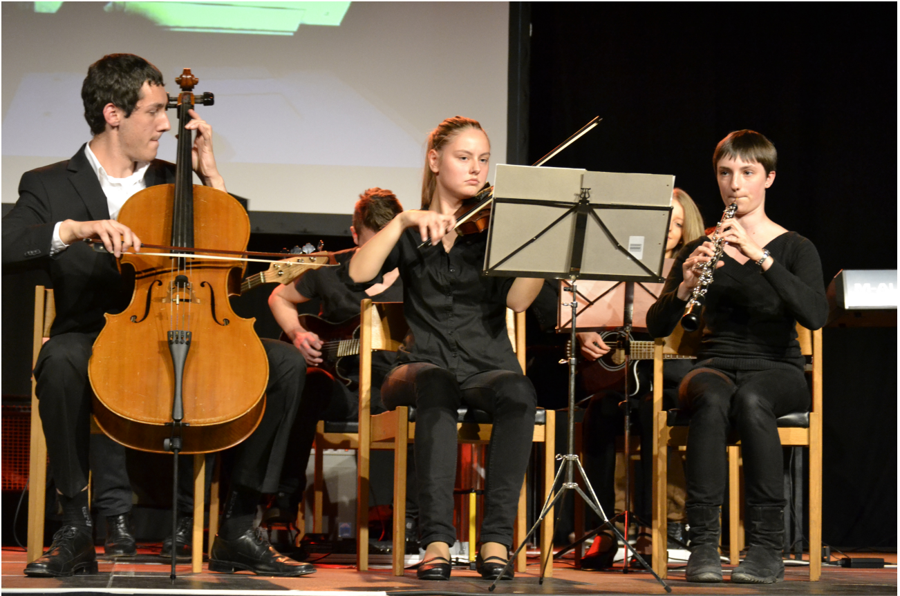
Abbildung 2

Das eben genannte Forschungsbeispiel dürfte deutlich machen, dass wir in der Wirkungsforschung zunächst phänomenologische Analysen der potentiellen Bildungsgehalte künstlerischer Tätigkeiten benötigen – ich möchte sie bildungstheoretische Strukturanalysen nennen. So zeigt beispielsweise Abbildung 2 musizierende Schülerinnen und Schüler im Rahmen eines Wettbewerbs der Kasseler Musiktage 2013.